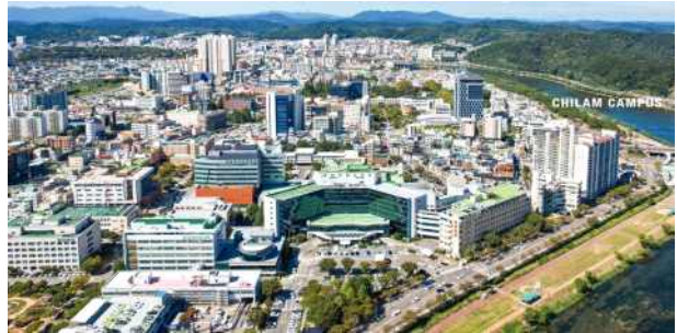
칠암 캠퍼스 [진주]