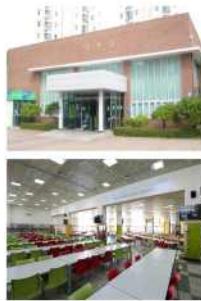
Cafeteria (Gajwa Campus)