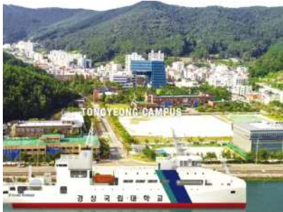
통영 캠퍼스 [통영]