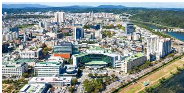
Chilam Campus (Jinju)