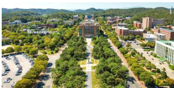
Gajwa Campus (Jinju)