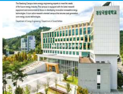
Naedong Campus (Jinju)