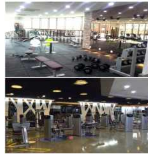
Fitness Center (Gajwa Campus)