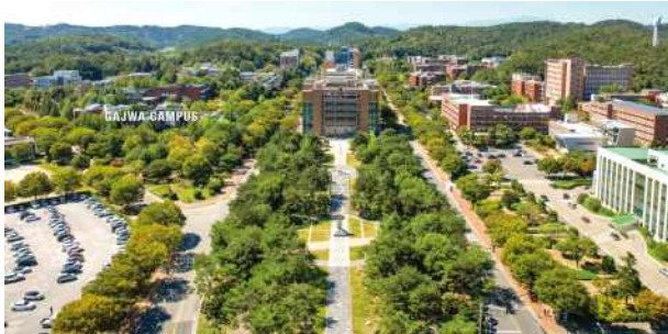
가좌 캠퍼스 [진주]