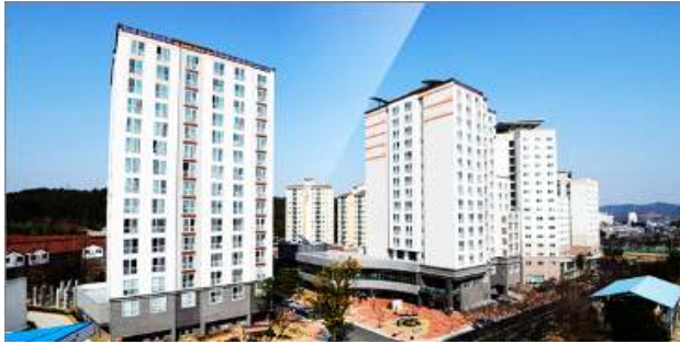
Gajwa Dormitory (Jinju)